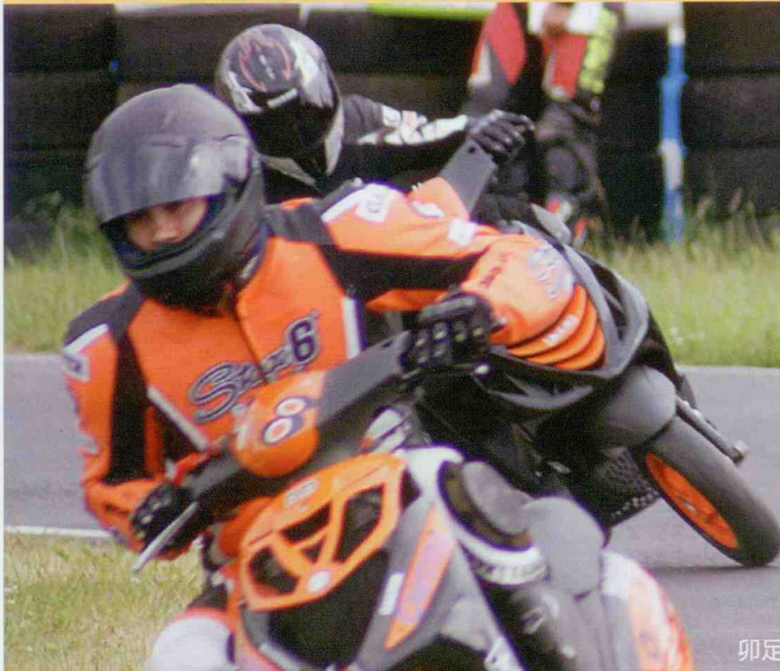
卯足全力奮勇一搏的時刻。