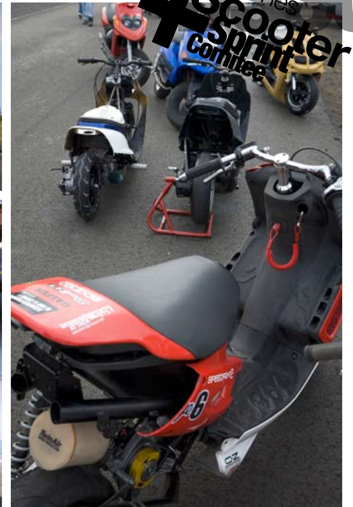
直線賽道我最快！參賽車手如飛沖天的飛鷹